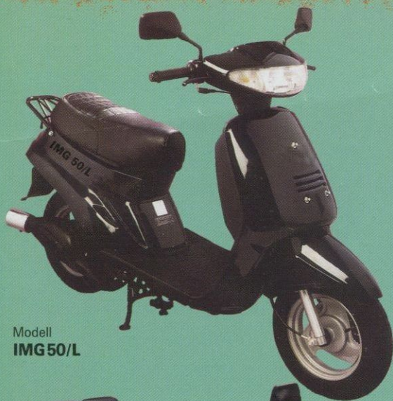
Modell IMG 50/L