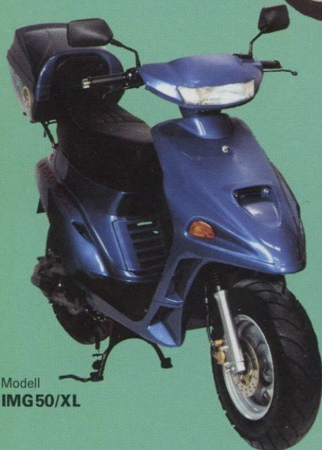
Modell IMG 50/XL